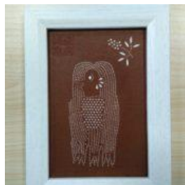
伊勢型紙アマビエ護札フォトフレーム

子の子安観音」の呼び名で親しまれる高野山真言宗の「子安観音寺」でご 祈祷し、鈴鹿市内の医療機関や調剤薬局、放課後児童クラブに寄贈したものと 同じ物です。アマビエについては皆さん良くご存知と思いますのでここでは 触れません。